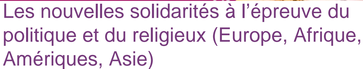
Table-ronde : CESSMA UMR 245-INALCO/ RIAM-FMSH/ ITEM-UPPA