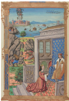
Ms. BnF Français 2818, f. 51v (Chroniques françaises du début du XVIe s.)