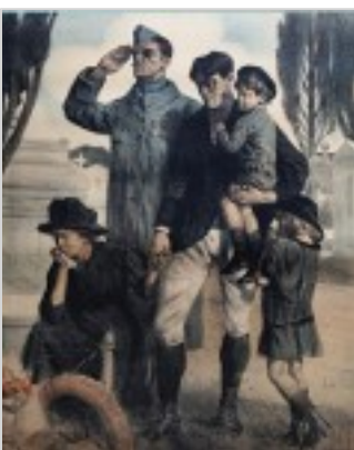
Musée d'Aquitaine - Bordeaux